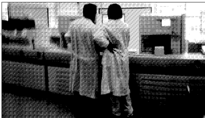
I laboratori dell'ospedale, dove vengono tratte e conservate in una banca le staminali.